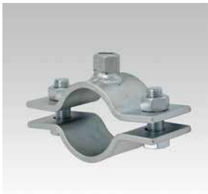
Vastpuntbeugel 60 x 6