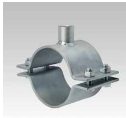
Vastpuntbeugel 120 x 6