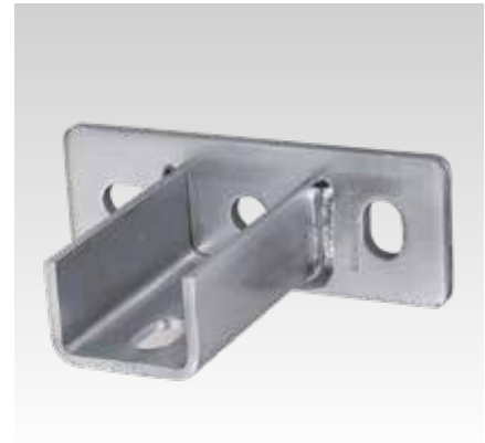
MPC Zadelflens, dwars