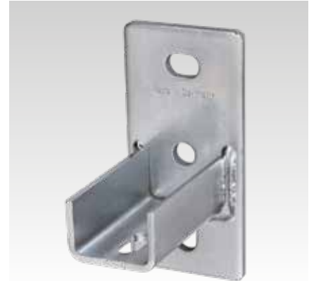
MPC Zadelflens, lengte