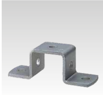
Voor profielen 28/30, 38/40