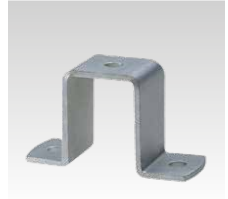
Voor profiel 40/60